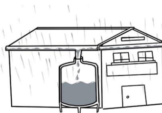
下雨時，雨水會沿著屋簷流入溝渠，最後接到雨水撲滿裡。

為了有效利用水資源，我們可以在學校製作雨水撲滿，收集雨水再加以利用。雨水撲滿的製作方式與概念如下：