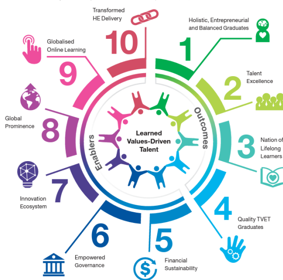
圖 1、2015-2025 年馬來西亞高等教育發展藍圖十大發展重點

資料來源：Ministry of Education Malaysia (2015).