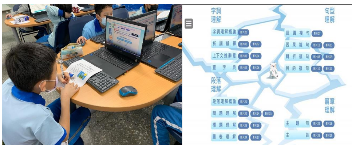
圖 1、學生在線上自主閱讀並透過自學任務，解救冰山上小北極熊

學習素材為以全球暖化議題為學習主題所研發之「別哭，小北極熊」數位閱讀策略自學模組，包含數位文本、自學影片、數位評量，以及可提供即時回饋之學後總結性評量。課文區內有字詞類、句型類、段落理解類與篇章理解類學習題組若干，各學習題組合前測、自學影音與形成性評量。自學區則包括前述教學成分之影音學習影片，並以達成拼湊冰山融塊以解救小北極熊的闖關概念。當學生完成各任務後，北極的融冰將組合，解救受困於浮冰的小北極熊（圖 1）。